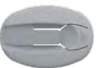
u Gris foncé