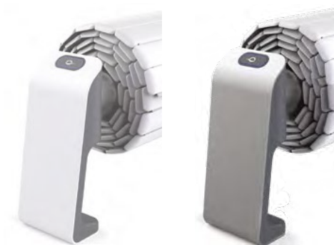
2 finitions couleurs : blanc laqué ou inox