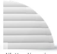
Ailettes découpées : rapport qualité/prix