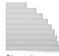
Découpe équerre : tolérance de la mesure