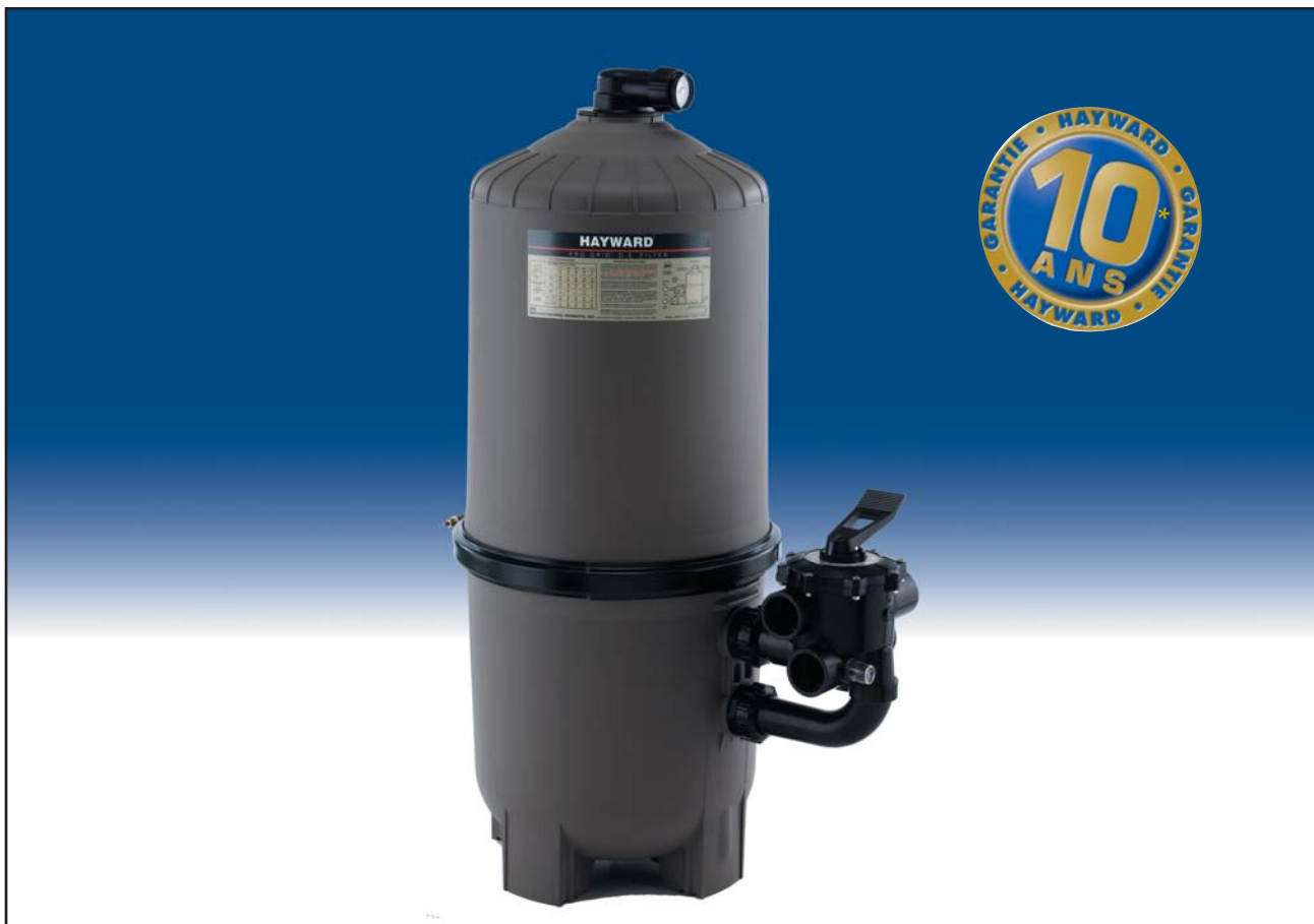
■ DE7220 : Filtre à diatomée Pro-Grid avec sa vanne 6 voies

FILTRES A DIATOMÉE / VERTICAL GRID D.E. FILTERS